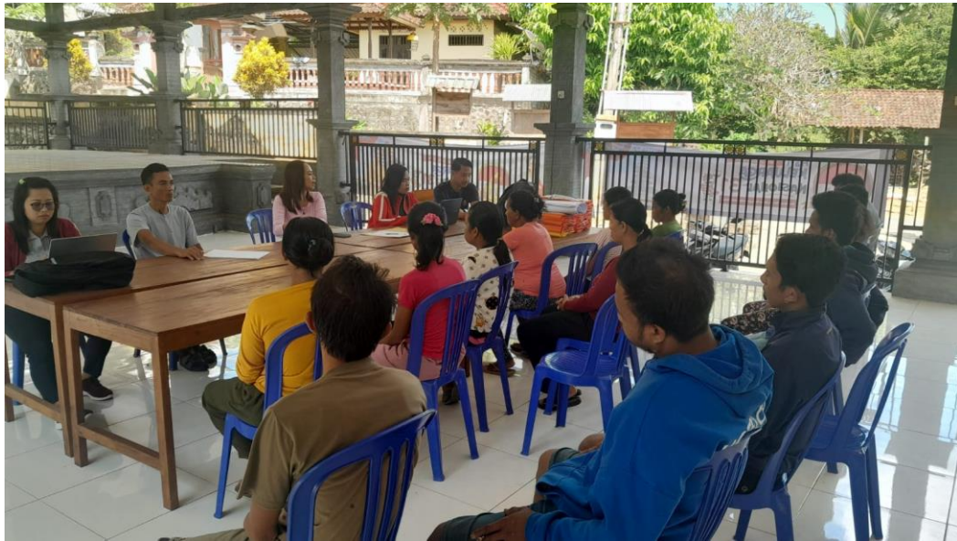
Gambar 7. Refleksi di PKBM Widya Aksara Terkait Kendala yang Dihadapi Ketika Menyusun Kurikulum Merdeka