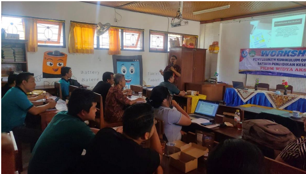
Gambar 4. Pelaksanaan PKM