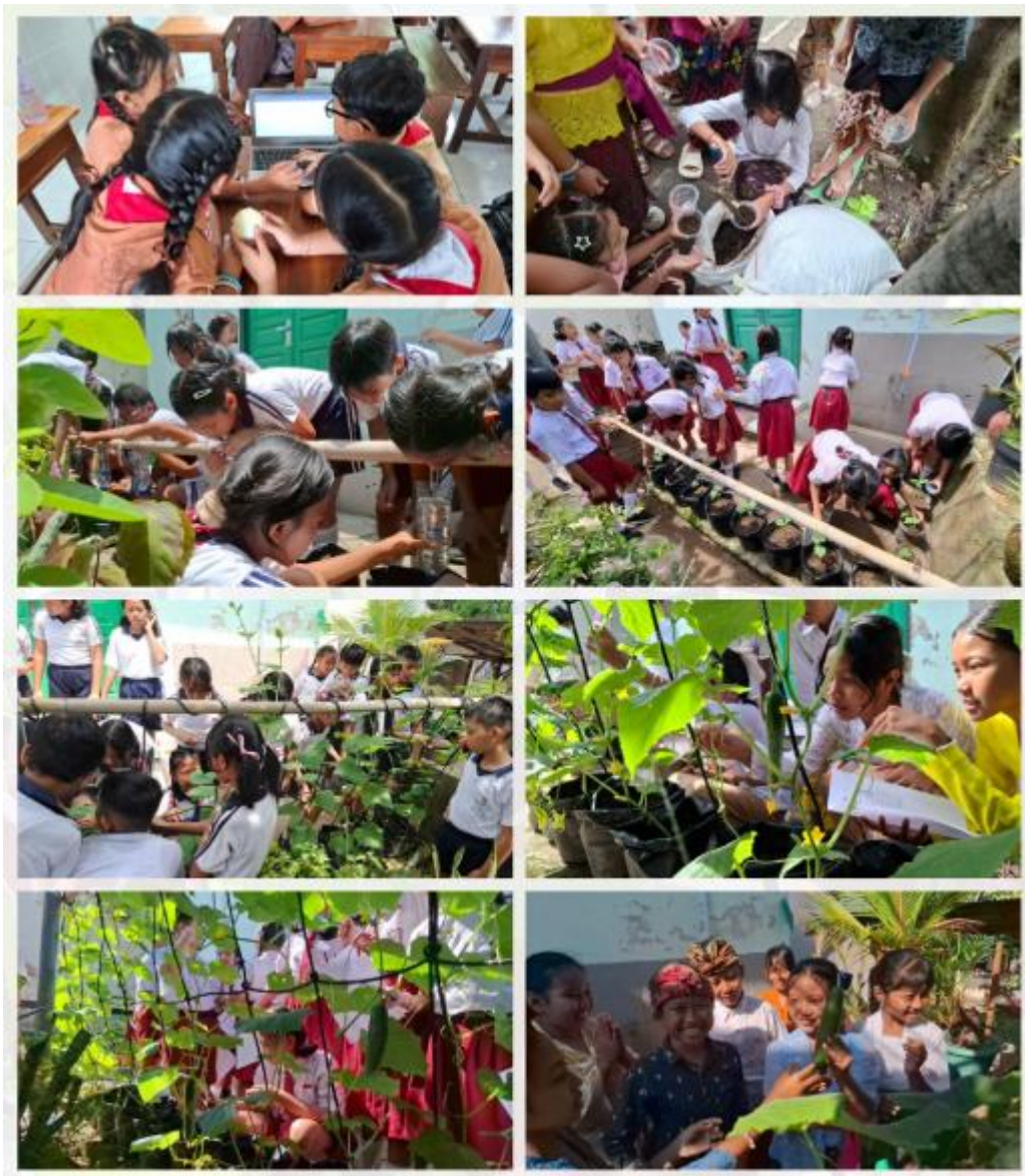
Gambar 3. Dokumentasi Pembelajaran Mendalam

Pada penggunaan teknologi digital, siswa menyadari bahwa informasi juga harus dipilah dan dipilih agar dapat bermanfaat pada praktiknya. Pada penggunaan teknologi digital ini, literasi digital juga tumbuh. Keterampilan menemukan informasi hingga menggunakan informasi menggunakan perangkat digital tumbuh dengan baik. Begitu juga etika, keamanan, dan budaya dalam menggunakan teknologi digital juga tumbuh seiring fasilitasi guru dan praktik yang dilakukan siswa menggunakan chromebook secara berkelompok. Informasi yang sangat melimpah di internet dapat menjadi sumber belajar yang optimal bagi siswa selama diiringi dengan fasilitasi tumbuhnya literasi digital bersamaan dengan itu.