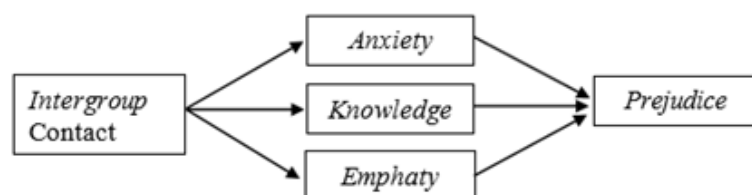
Gambar 1. Contact-prejudice mediation model ((Pettigrew & Tropp, 2008), p. 928).

Persepsi masyarakat terhadap program ini menjadi faktor kunci dalam keberhasilannya. Di sinilah relevansi Teori Persepsi Sosial dari (Allport, 1954) berperan penting. Allport menjelaskan bahwa persepsi sosial adalah proses penilaian individu terhadap suatu situasi sosial, yang dipengaruhi oleh faktor internal (pengetahuan, pengalaman, motivasi) dan eksternal (lingkungan sosial, budaya, norma) seperti yang ditampilkan pada gambar 1. Pemerintah harus mampu memastikan kepada seluruh masyarakat bahwa program yang akan dijalankan akan menjawab seluruh ketakutan dan kebutuhan mereka. Pemahaman akan persepsi masyarakat dapat membantu perancang kebijakan menyusun pendekatan yang lebih efektif dan kontekstual agar Sekolah Rakyat diterima dan berjalan optimal.